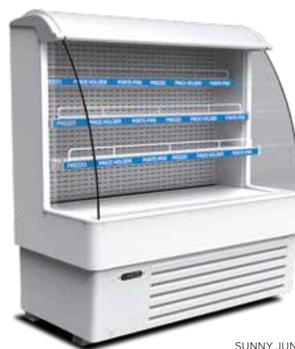
SUNNY JUNIOR SL 14

SL 10 886 x 160 mm (l x p) 886 x 265 mm (l x p) 886 x 350 mm (l x p) SL 14 1236 x 160 mm (l x p) 1236 x 265 mm (l x p) 1236 x 350 mm (l x p)