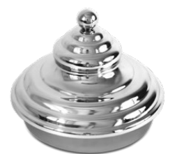
Coperchio piramidale Pyramidal lid

Carapine non fornite Cylindrical tubs not included