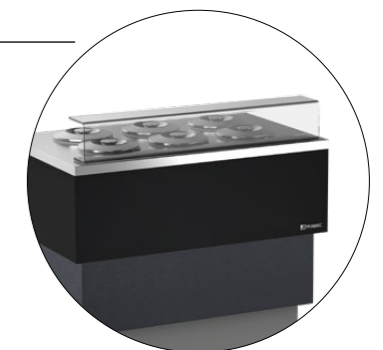
Alzata con piano di servizio in plexiglass Plexiglass stand with working top

Carapine non fornite Cylindrical tubs not included