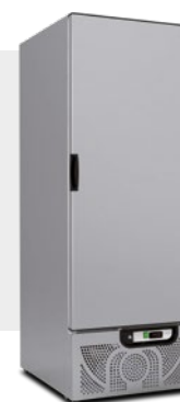
CHEF 600 NX