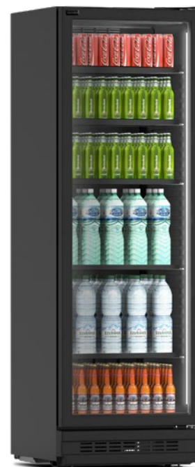
ACQUA P 400 B